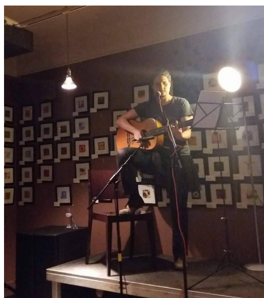
Konzert von Tinou & the Emancipatory Jukebox